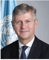
Jean-Pierre Lacroix Secrétaire général adjoint aux opérations de maintien de la paix

En travaillant à tous les niveaux pour mieux contrôler et gérer les armes et les munitions, nous pouvons faire reculer la violence, réduire la souffrance humaine et préparer le terrain pour des solutions politiques inclusives et un avenir plus pacifique.