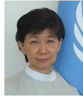
Izumi Nakamitsu Haute-représentante et Secrétaire générale adjointe pour les affaires de désarmement