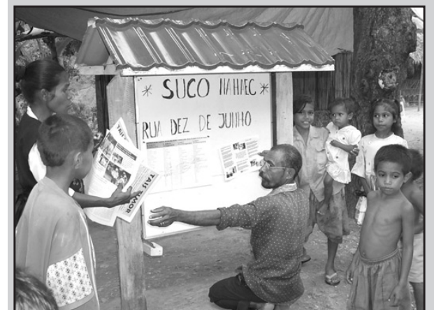
Halo la'o lian foun: Kopia ikus Tais Timor nian ba to'o suku nia quadro bulletin - dalam diak ida ba comunidade sira nebe buka hatene lian kona ba mamosuk nasional.

Kuadro Buletin Informativu UNTAET nia iha fatin diak ida i tau mos iha Tais Timor, atu bele hetan informasaun jeral kona ba emprego i reabilitasaun nasaun nian.