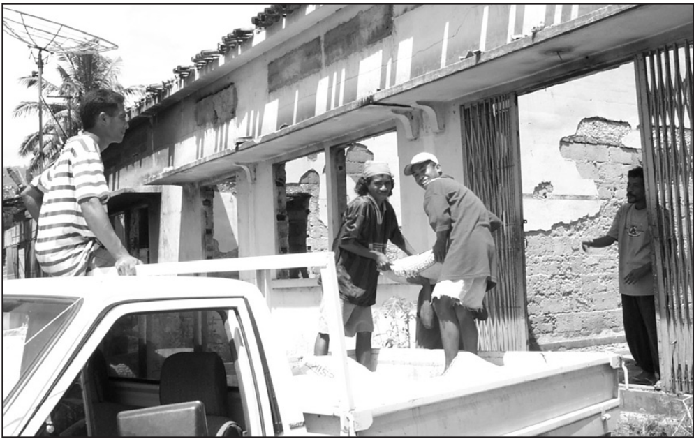
Serbisu-nain tulun hamoos sasan rahun iha uma Dili ida, atu bele hari ema Timor nia negosiu foun