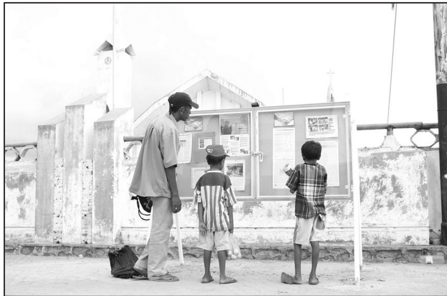
EMA TIMOR LEE KUADRO BULETIN INFORMASAUN UNTAET NIAN IHA KATREDAL DILI. KUADRO SIRA NE'E TAU IHA ADMINISTRASAUN DISTRITU NIA ESKRITORIU SIRA IHA PAIS NIA LARAN. PLANU HAHU ONA ATU HARI TAN KUADRO UALU IHA FATIN SELUK IHA KAPITAL NIA LARAN HO MOS IHA ADMINISTRASAUN SUBDISTRITU NIA ESKRITORIU IHA TIMOR LESTE.