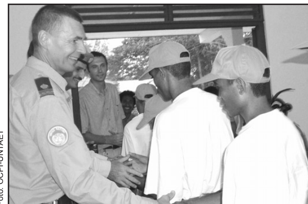
O oficial da CivPol Ingemar Eriksson saudando o primeiro curso de cadetes, quando da inauguração da Escola de Polícia de Timor Leste.

Na sua alocução aos cadetes, o Chefe da Administração de Transição, Sérgio Vieira de Mello, continua na página 6