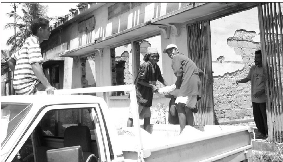
Operários ajudam a limpar os destroços de um edifício de Díli, que se destina a ser a sede de uma nova empresa gerida por timorenses.

comerciais privadas chegaram a Timor Leste, nos últimos meses, dando um impulso e gerando oportunidades de emprego para a economia destruída.