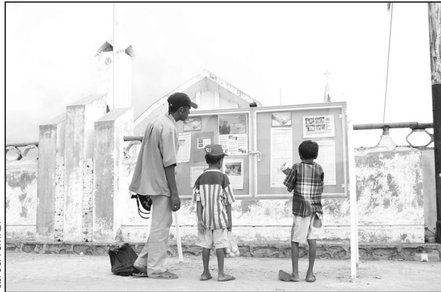
Timorenses a lerem um dos Painéis de Afixação de Informações da UNTAET, mesmo à porta da Catedral de Díli. Os Painéis estão colocados nas Sedes de Administração de Distrito em todo o país. Estão a ser elaborados planos para a instalação de mais oito, noutras localidades em redor da capital, e outros 56, em Sedes de Administração de Subdistrito em todo o território de Timor Leste.