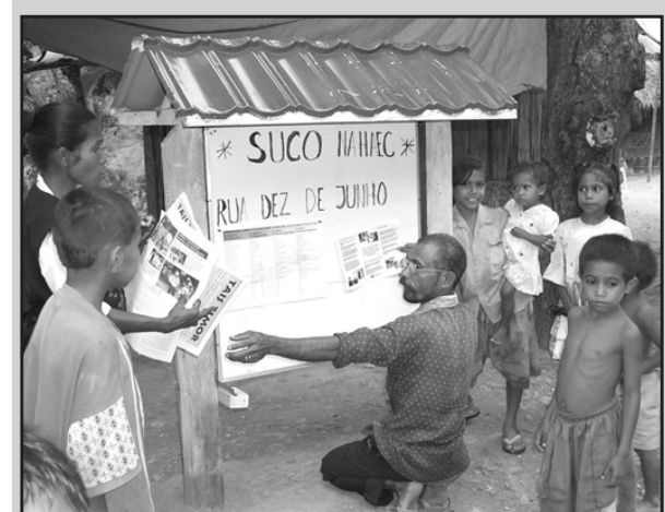
Afixando as notícias: A última edição do Tais Timor colocada num painel de afixação de um suco - uma boa forma de consciencializar as comunidades do que se está a passar a nível nacional.

Também os iremos mantendo informados - através dos Painéis de Afixação e do Tais Timor - acerca de quaisquer cursos de línguas e de formação profissional em informática, gestão administrativa, mecânica, etc., que possam ir começando.