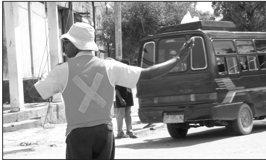
Guarda trafigu sira hametin orden iha luron iha sidade laran.

Liafuan ikus ba xofer sira nebe kaer kareta ho lanun iha Dili - Indonesia nia lei mos rigorozu uitoan. Se aplika halo lolos, sei lori imi ba kadeia iha fulan tolu nia laran, eh multa ho osan rulia tokon tolu (juta tolu).